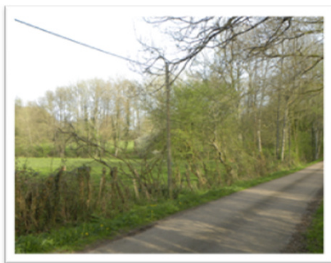
Haie dégradée, fort peu épaisse, en bordure d'une Voie Communale ; sa base est discontinue, les arbustes la constituant étant dépérissants. Sa biodiversité, floristique en particulier, est faible.