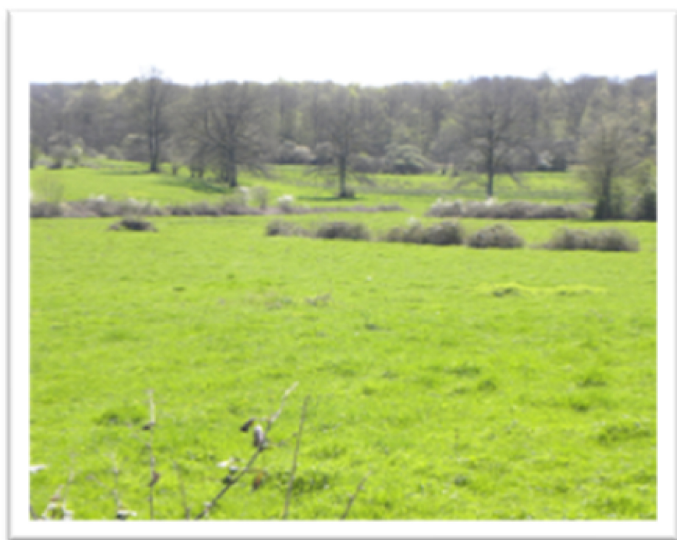
Ensemble de haies médiocres dans une zone prairiale qui tapisse un fond de vallée humide. Ces haies se sont développées le long de clôtures, par ornithochorie.